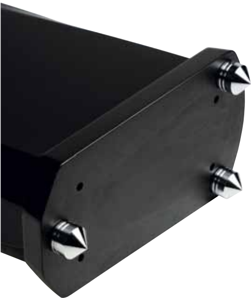
Die drei gigantischen Spikes sind höhenverstellbar, das Gewicht verteilt sich dank der physikalischen Gesetze von alleine perfekt