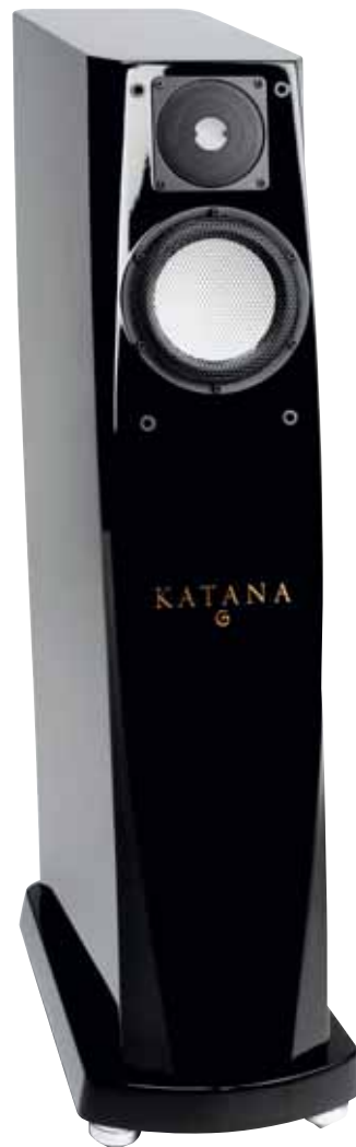
Geschwungene Linien, angelehnt an das namensgebende Schwert, verleihen der Box ein hochattraktives Äußeres

Im Endeffekt nützen aber auch die besten Treiber wenig, wenn das Drumherum nicht stimmt. Das hochglanzlackierte Gehäuse der Katana, welches Schwarz auch in Ebenholz- und Palisanderfurnier